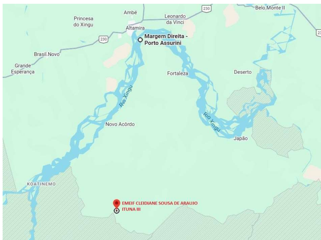
Figura 2 - EMEIF CLEIDIANE SOUSA DE ARAUJO

11.1.1. A construção da escola será realizada na Região do Ituna III, localizada no Travessão da Firma km 124 – Assurini, Altamira/PA.